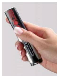
NUOTOLINIS VALDYMAS Saugus 868.8 MHz veikimo dažnis