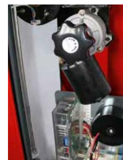
INOVATYVI TECHNOLOGIJA Apsauga nuo perkrovos, integruotas nuotolinio valdymo imtuvas