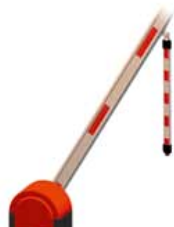
Mobili atrama 7615V000