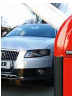
DIDŽIAUSIAS SAUGUMAS Automatinis klišių aptikimas - aptikęs klišių užtvaras automatiškai atsideda