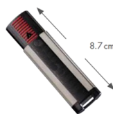
Nuotolinio valdymo pultelis STICK 4